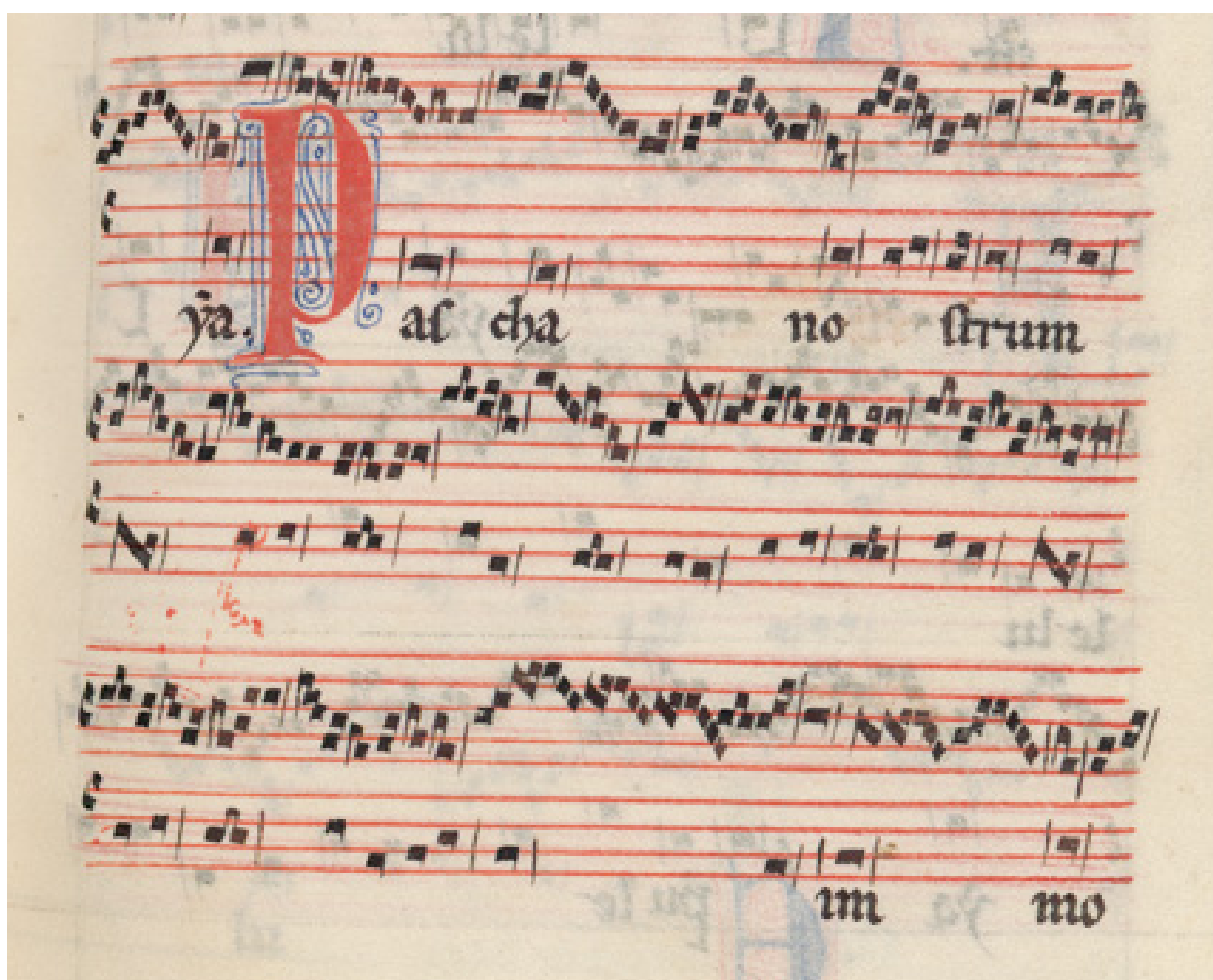
Figura 2: Organum en el códice de Florencia